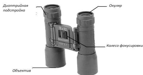
Бинокль на призмах Порро (Porro)

Некоторые бинокли с большим диаметром объективов имеют встроенный штативный адаптер, являющийся частью жесткой переключателя бинокля, который может быть напрямую присоединен к стандартному фотографическому штативу.